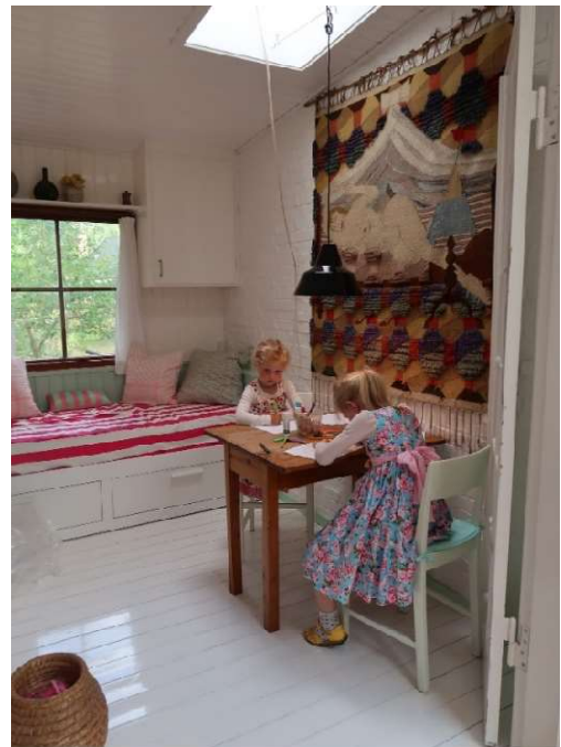
Det nye værelse i det gamle køkken