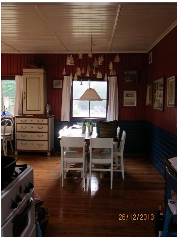
Den gamle stue uden ovenlys