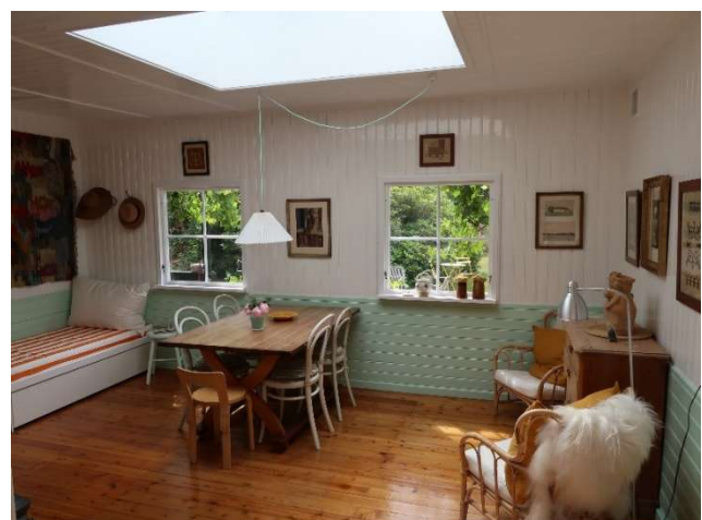
Den nye stue med ovenlys