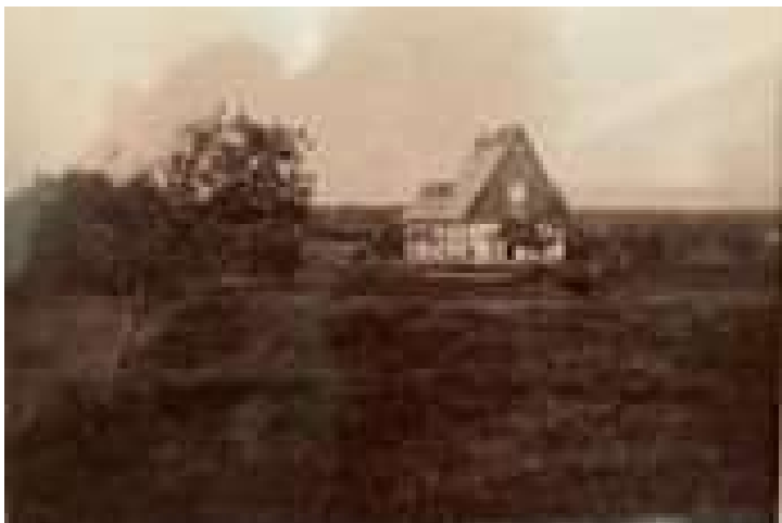
Foto af huset dengang