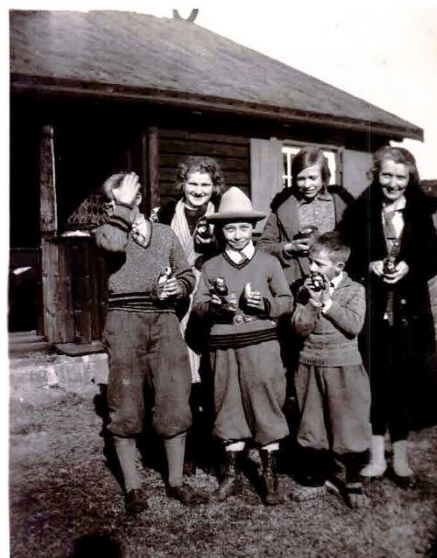
Der findes påskeæg i påsken 1929. Det er min farmor th.

Vi sætter stor pris på den fred og ro der hviler over området og på de gode naboer. Lad os håbe vi kan bevare det i fremtiden