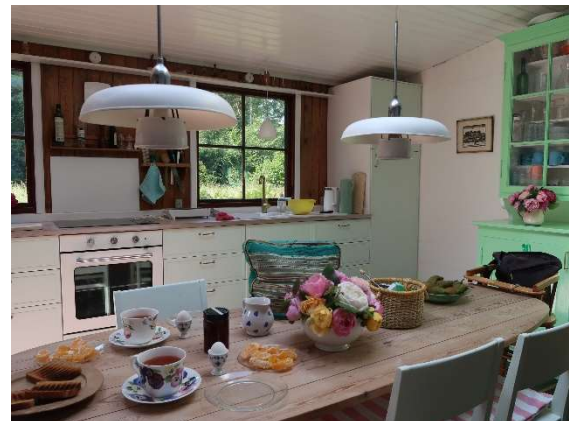
Pejsestuen bygges om til et køkken alrum. Det er nu nemmere at indtage måltider lige uden for døren mellem hovedhus, gæstehus og værksted.