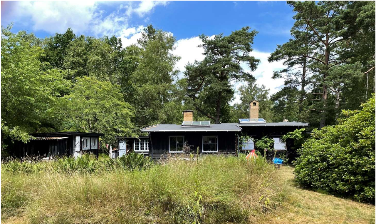
De to nye tage set fra haven.