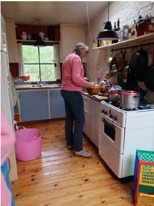
Det gamle køkken