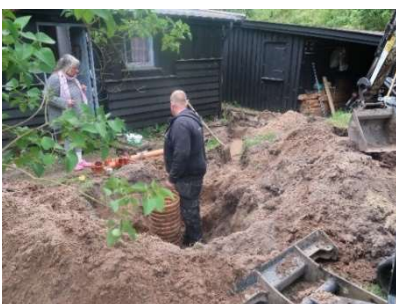
Der lægges ny kloak og nye vandledninger.