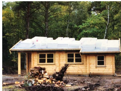
Huset blev indviet i oktober 1993.