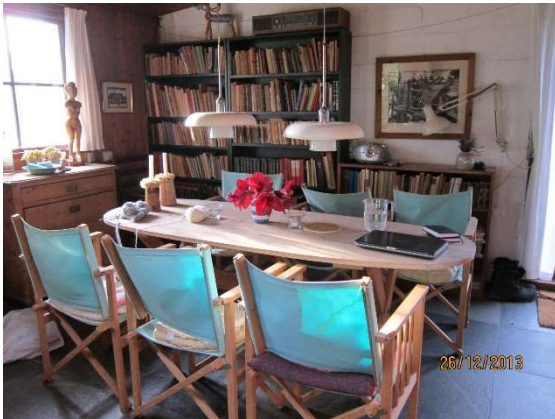
Så gælder det nyt køkken i den gamle pejsestue